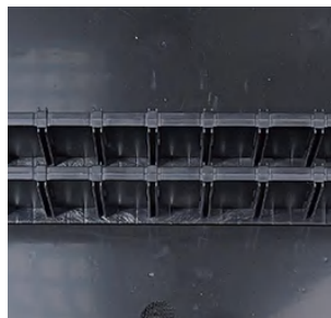
英特尔 (拉杆款) INTERCASE MOBILE

62mm 高 (2根插板) 2.4 inch height (2 dividers)