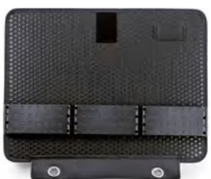
示例图像 | example image