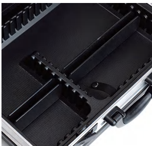
维拓 (手提款) VITAL

54mm 高 (2根长插板, 2根短插板) 2.1 inch height (2 long dividers, 2 short dividers)