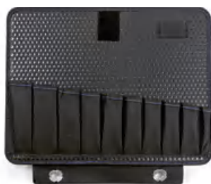
示例图像 | example image