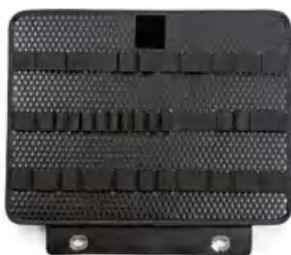
示例图像 | example image