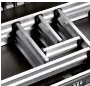
SET 4 70mm 高 (3根插板, 4个连接件, 6个插板帽) 2.8 inch height (3 dividers, 4 middle caps, 6 adapter pieces)