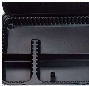
维拓 (拉杆款) VITAL MOVE

54mm 高 (2根长插板, 2根短插板) 2.1 inch height (2 long dividers, 2 short dividers)