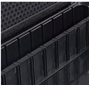
英特尔 (手提款) INTERCASE SMALL

70mm 高 (2根长插板, 2根短插板) 2.8 inch height (2 long dividers, 2 short dividers)