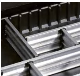
SET 3 60mm 高 (2根插板, 2个连接件, 4个插板帽) 2.4 inch height (2 dividers, 2 middle caps, 4 adapter pieces)